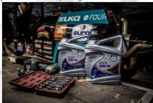
Eurol Specialty Racing 10W-60