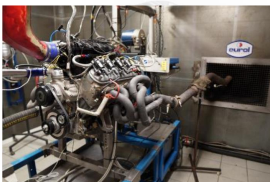
Двигун LS3 (стендові випробування)